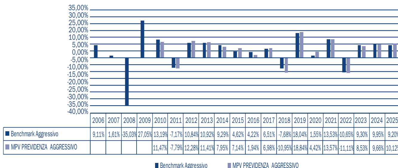
Tav. 4 – Rendimenti netti annui (valori percentuali)

Benchmark: 45% MSCI Europe; 21% MSCI USA; 12% MSCI Emerging Markets; 12% MSCI AC Pacific; 5% JPM Emu Global Government Bond Index LC; 5% ML Euro Treasury Bill. È intenzione della Compagnia attuare una politica di gestione attiva, al fine di cogliere opportunità di mercato, con l'obiettivo di superare il Benchmark nel medio lungo termine.